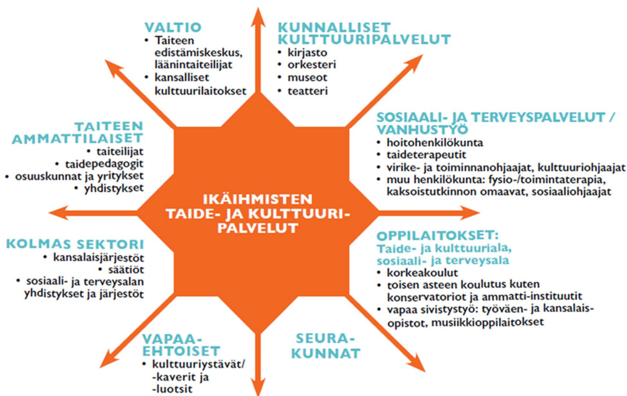
KUVIO 1 Ikäihmisten kulttuuripalveluita tuotetaan monen toimijan yhteistyönä. Kuva: Rosenlöf, Anna-Mari: Rakenteita ratkomassa – Kulttuurisen seniori- ja vanhustyön käytäntöjä ja toimintamalleja (2014).

Helsingin kulttuurikeskus on taiteen, kulttuurin ja luovuuden edistäjä, joka kehittää kulttuurisesti rikasta ja monimuotoista Helsingin seutua. Kulttuurikeskus tukee kulttuuria avustuksin sekä tarjoamalla esiintymis- ja työskentelytiloja taiteilijoille. Kulttuurikeskus tuottaa kulttuuritoimintaa sekä itse että yhteistyössä muiden toimijoiden kanssa. Kulttuurikeskuksen tehtävänä on edistää kulttuuria toimimalla aloitteellisesti ja tavoitteellisesti kulttuuripolitiikassa paikallisella, kansallisella ja kansainvälisellä tasolla. Kulttuurikeskuksen toimintaa ohjaa Helsingin kulttuuri- ja kirjastolautakunta.